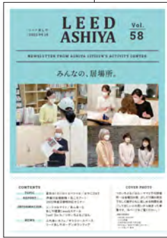
季刊紙 58 号表紙

ホームページ、SNS、ニュースレターなどの Web 媒体と季刊紙、NPO 通信の紙媒体を利用してイベントや助成金関連の情報を発信しています。団体や市内情報の発信の独自のアプリとしては、2017 年から「ためまっぷ芦屋」の運営に取り組んでいます。