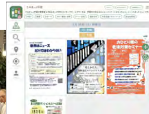
ためまっぷ芦屋 トップページ