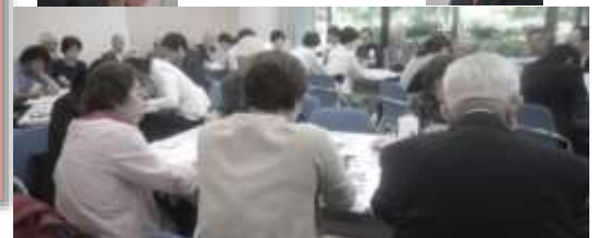
クロスロードゲーム